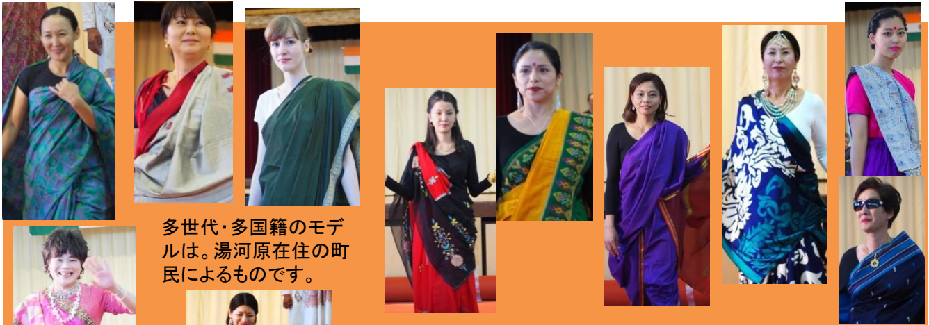
多世代・多国籍のモデルは。湯河原在住の町民によるものです。