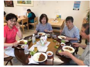
「カフェたんぽぽ」にて