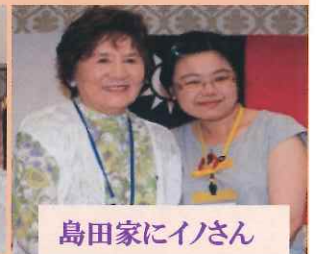
島田家にイノさん

数えること30回目のやっさ国際交流。9カ国21名の留学生を迎え日本での日常生活や文化体験、楽しく濃い一週間を過ごしました。恒例のやっさ祭りでは “やっさ準大賞”初受賞! 踊りのまともりもさることながら、家族として受け入れて頂いたホストファミリーの皆さんと楽しい毎日を送ったその笑顔に贈られたのではないのでしょうか。その笑顔、今年も!そして来年も!