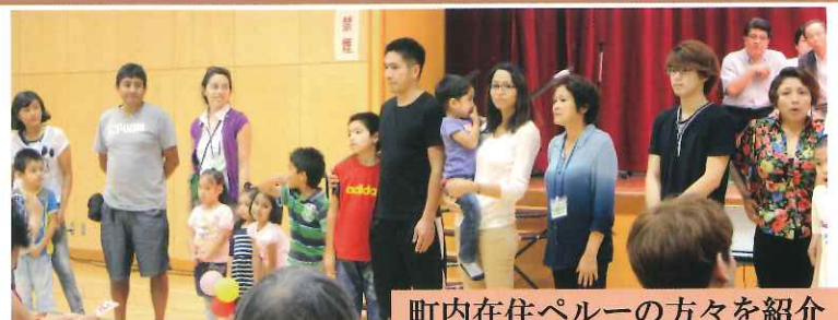
町内在住ペルーの方々を紹介