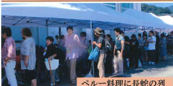
ペルー料理に長蛇の列

ペルーは中南米で最初に日本との外交関係を結んだ国であり、日本人移民がペルーに渡って116年、日系人大統領フジモリ氏も誕生している。明治から大正、昭和、平成と4世代にわたって友好的な関係を維持している。湯河原在住のペルー人家族も多く、湯河原ペルー人会の協力とペルー大使館の後援も得てくペルーの日」を実施した。午前は日本とペルーのファミリーが参加しての「親睦フットサル大会」と、「ペルーの子どもの遊び」で汗を流し、ペルーの食文化紹介では行列ができるほどの盛況の中、インカコーラを飲みながら香ばしい香りのペルー料理を満喫した。（K.S）