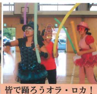
皆で踊ろうオラ・ロカ！