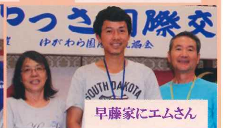
早藤家にエムさん