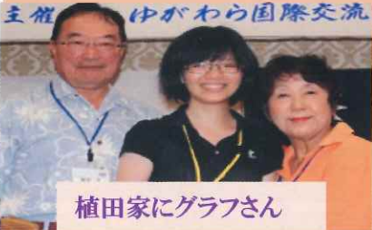
植田家にグラフさん