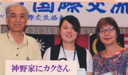
神野家にカクさん