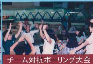
チーム対抗ボーリング大会