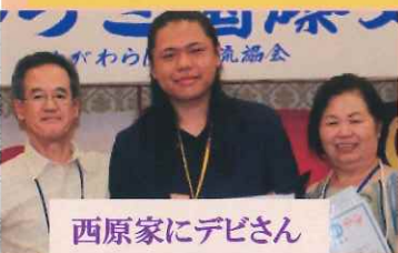
西原家にデビさん