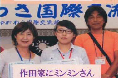
作田家にミンミンさん