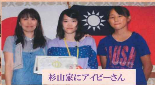
杉山家にアイビーさん