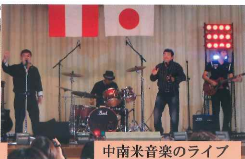
中南米音楽のライブ