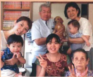
善本家にユニさん ベテラン ホスト、ファミリーの善本家にユニさんが加わりました! が加わりました!