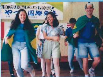
90年代のユースサミット