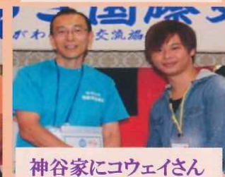
神谷家にコウエイさん