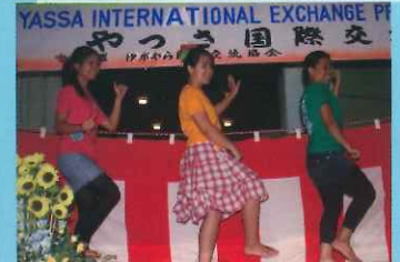
20周年記念式典・屋台村・各国文化披露