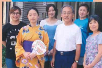
広井家にアオさん 広井家に以前、ホームステイした2人の先輩と一緒に“やっさ!!”