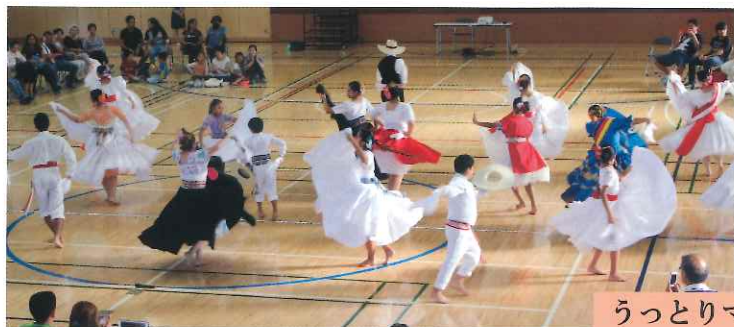
うっとりマリネラ舞踊

午後からはマチュピチュを世界遺産に導いた日本人の興味ある講演。続いて南米三大舞踏（サンバ、タンゴ、マリネラ）のひとつマリネラの大変優雅で華やかな群舞をたっぷり鑑賞し、ペルー人会によるラテン音楽の生演奏、ラストダンスは「オラ・ロカ」で全員で踊り狂うほどの楽しい一日となった。（K.S）