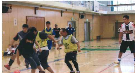
午前の白熱のフットサルとペルーの子供の遊び