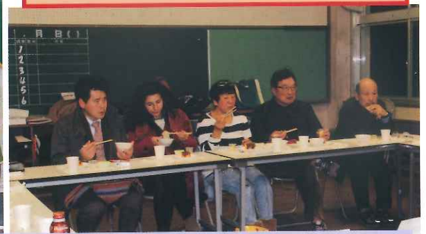
最終回、講師の手作りの珍しいケーキや ジャガイモのサラダ、タイカレーに舌鼓

教科書に載っていない、ガイドブックでもわからない『楽しいこと』『なるほど』がいっぱい！をテーマに、言葉と文化を学びました。挨拶や生活習慣、国旗や紙幣、観光地やスポーツ、年末年始の過ごし方、そして食事についてなど話題は尽きません。スペイン語の巻き舌の発音、ポルトガル語とスペイン語の類似性、タイ文字の書き順に驚いたり、いろいろな発見がありました。5回の講座を通じて、各講師の方々にも自国についての再確認、他国の文化や言葉を理解できたという言葉頂きました。毎回、各国にちなんだお菓子や飲み物も楽しみの一つでした。(鈴木明子)