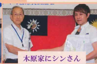
木原家にシンさん