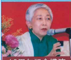
10周年記念講演 金美齢先生