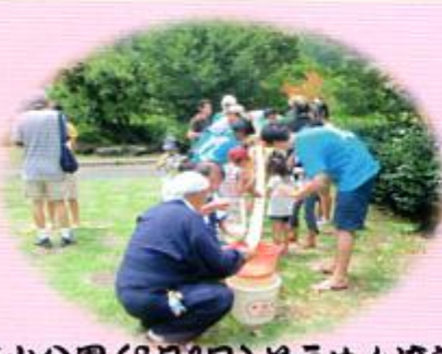
幕山公園(8月7日)そうめん流し