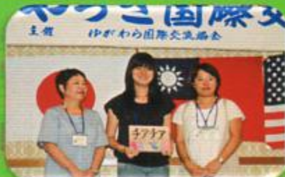
Sanchia (チアチア) 坂本 & 善本ファミリー (インドネシア)