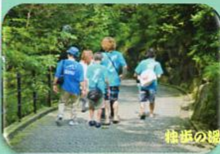
松木の郷体験 (8月7日)