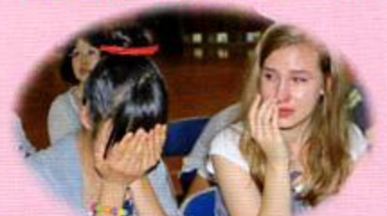
別れの時/湯中体育館 7月11日