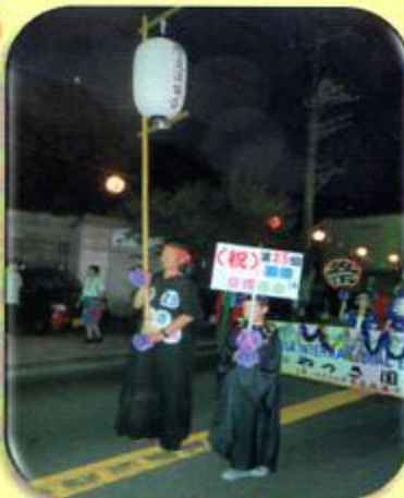
やっさパレード(8月2日)