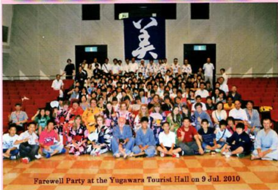
Farewell Party at the Yuzawa Tourist Hall on 9 Jul. 2010